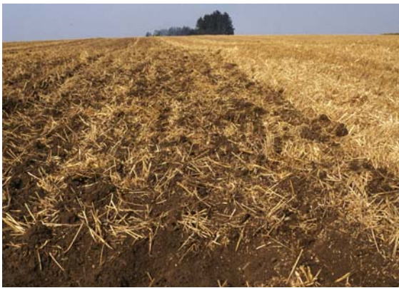
Abb. 51: Gleichmäßige, flache Stroheinarbeitung unmittelbar nach der Ernte fördert die Rotte und vermeidet beim späteren Pflügen die „Matratzenbildung“