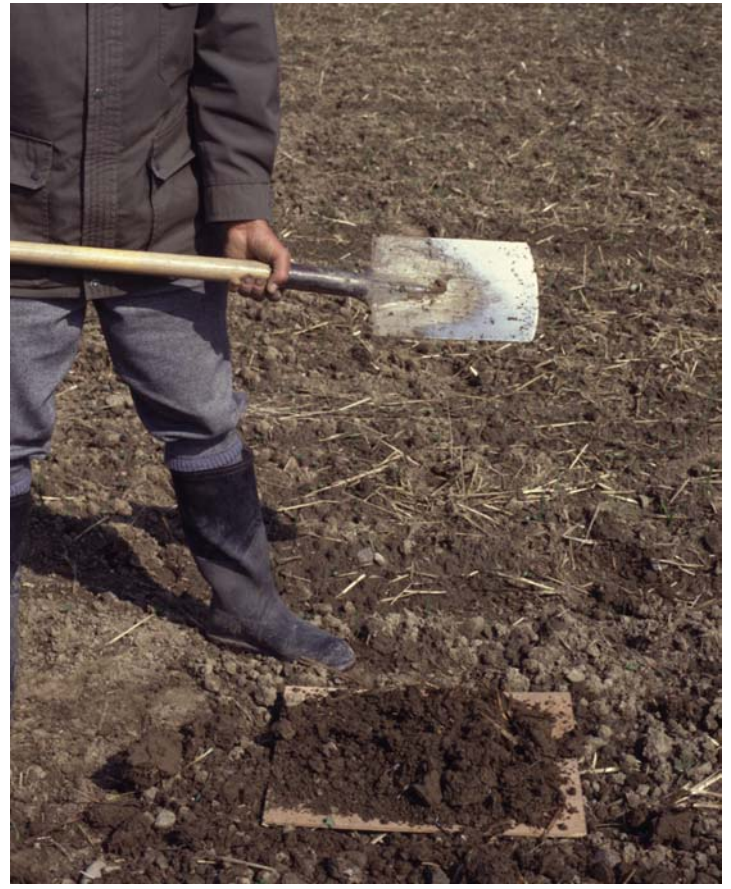
Abb. 13: Beim Aufprall auf eine feste Unterlage (Brett) zerfällt der Bodenblock in seine natürlichen Gefügeaggregate