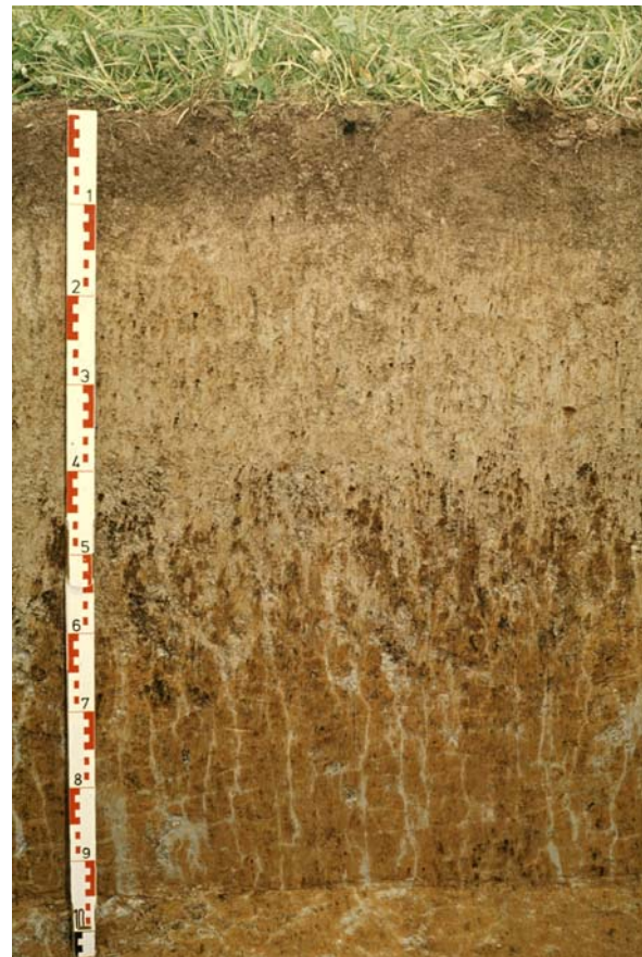
Abb. 49: Die hell gefärbte Schicht mit schwarzen, harten kugeligen Einschlüssen (Konkretionen) im oberen Teil des Bodenprofils weist auf Wechsel zwischen Austrocknung und Vernässung hin; Rostfärbung und graue Marmorierung sind kennzeichnend für den dichtgelagerten, wasserstauenden Untergrund (Pseudogley aus Lößlehm)