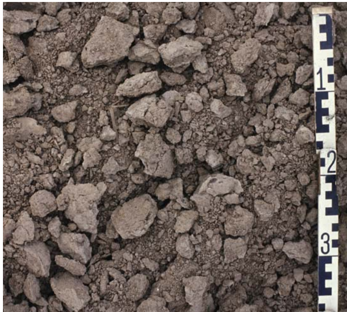
Abb. 21: Lößlehm Boden, sautfertig: Einmaliges Bearbeiten mit Eggen-Krümler-Kombination schafft ausreichend Feinboden für die Einbringung der Saat. Die groben Gefügeaggregate wirken der Verschlämmung und dem Oberflächenabfluss entgegen

Leicht zu Verschlämmung neigende Böden (schluffreiche Böden, Lößböden) dürfen nicht zu fein bearbeitet werden. Den besten Schutz vor Verschlämmung (und Erosion) bietet eine Bodenbedeckung durch Pflanzen oder Ernterückstände.