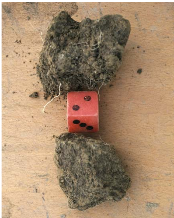
Abb. 35: Je nach Porosität und Festigkeit erhalten Bröckel die Gefügenre 2 oder 3; oben: lockerer, poröser Bröckel (2) unten: dichter, fester Bröckel (3)