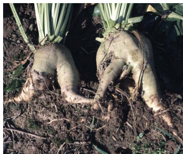
Abb. 45: Beinige Rüben als Folge starker Verdichtungen in der Unterkrume (ungünstig)