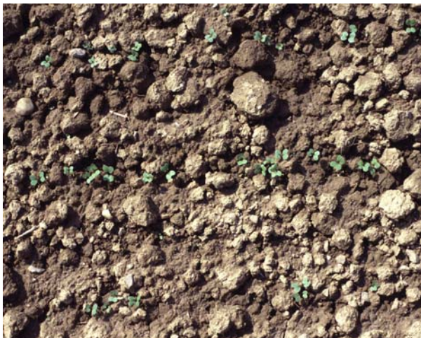
Abb. 22: Bodenoberfläche zwei Wochen später: Die Rapssaat ist gut aufgelaufen. Die relativ „raue“ Bodenoberfläche schützt die jungen Pflänzchen