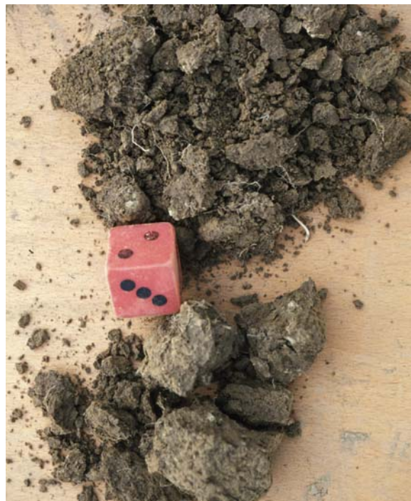
Abb. 36: Zerfall der abgebildeten Bröckel bei Druck (der rote Würfel hat eine Kantenlänge von 3 cm)