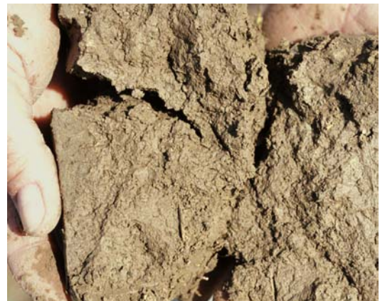
Abb. 30: Kohärentgefüge, ungünstig (Gefügenote 4), stark verdichteter Lössboden aus einer Fahrgasse