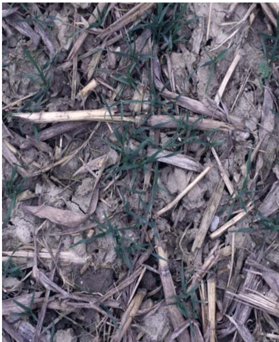
Abb. 26: Auf der Bodenoberfläche belasse- ne, allenfalls flach eingearbeitete Ernte- rückstände schützen vor Verschlammung und Oberflächenabfluss. Im Bild: Pfluglos bestellter Winterweizen nach Körnermais ; die Grundbodenbearbeitung erfolgte mit dem Grubber.