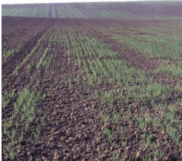
Abb. 5: Ungleichmäßiger Aufgang der Wintergerste aufgrund mangelnden Bodenschlusses durch ein zu grobes Saatbett