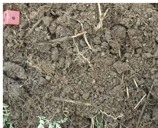
Abb. 32: Krümelgefüge aus der Oberkrume eines Zwischenfruchtbestandes (Abwurfprobe)