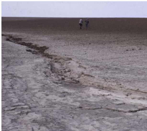
Abb. 7: Bodenerosion im Lößgebiet. Verschlammung und gehemmte Versickerung fördern den Oberflächenabfluss und damit den Bodenabtrag. Nach Abtragung des hell gefärbten Oberbodens („Weißlehm“) kommt der rötlich-braun gefärbte, tonige Unterboden an die Oberfläche („Rotlehm“, oberer Bildrand)