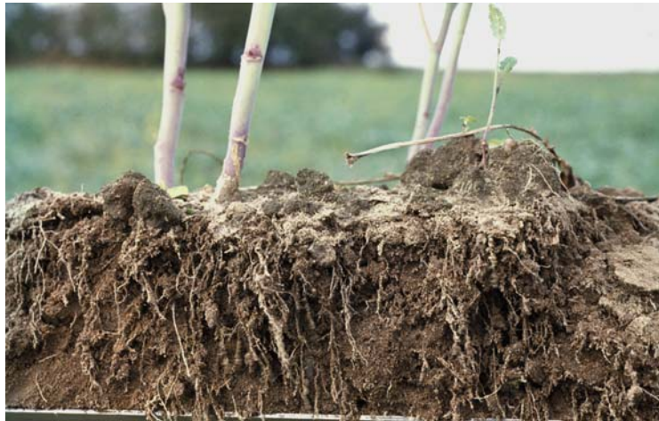
Abb. 41: Gleichmäßige, dichte Feindurchwurzelung eines Krümelgefüges (sehr günstig)

Das Bodengefüge ist der Lebensraum der Pflanzenwurzeln. Unter einem wachsenden Pflanzenbestand kann man sich deshalb der Pflanzenwurzeln als eines direkten Bewertungsmaßstabs bedienen.