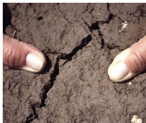
Abb. 20: Aufbrechen des Bodenblocks mit den Händen: Der Kraftaufwand steigt mit der Dichtlagerung