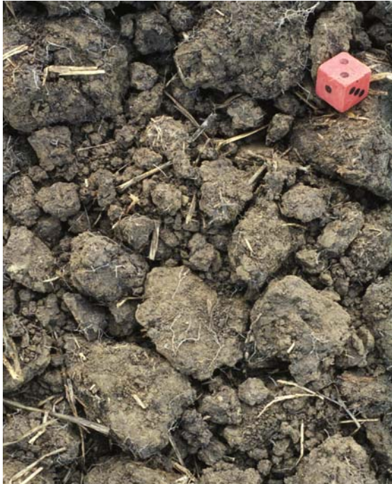
Abb. 33: Bröckelgefüge sind typische Gefü- geformen der Unterkrume (Gefügenre 2–3)