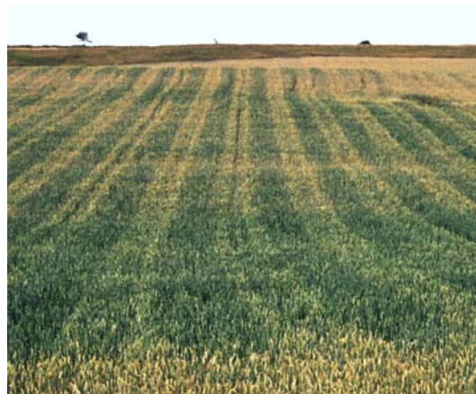
Abb. 4: Vorzeitige Abreife des Getreides auf den bei der Bestellung verursachten Verdichtungen in den Fahrspuren (Wassermangel)