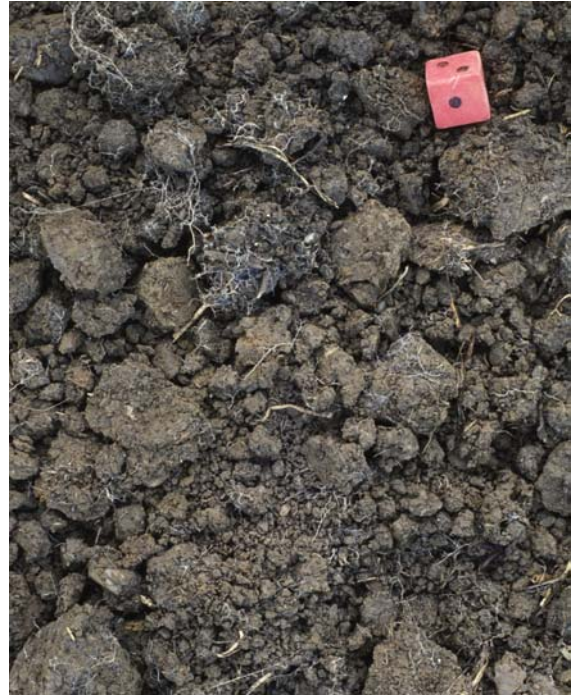
Abb. 34: Mischgefüge aus etwa 50% Krü- meln und 50% Bröckeln (Gefügenre 1,5)