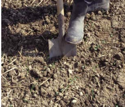
Abb. 8: Einstechen des Spatens: Der Eindringwiderstand lässt bereits auf die Dichtlagerung schließen