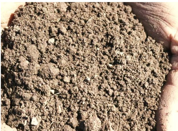
Abb. 31: Krümelgefüge aus einer Grünlandkrume; ideales Gefüge (Gefügenote 1)