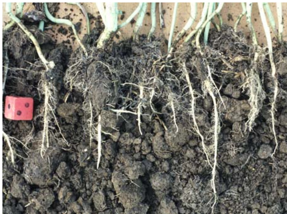
Abb. 42: Ungestörte Tiefendurchwurzelung in einem krümelig bröckeligen Gefüge (günstig) - Abwurfprobe