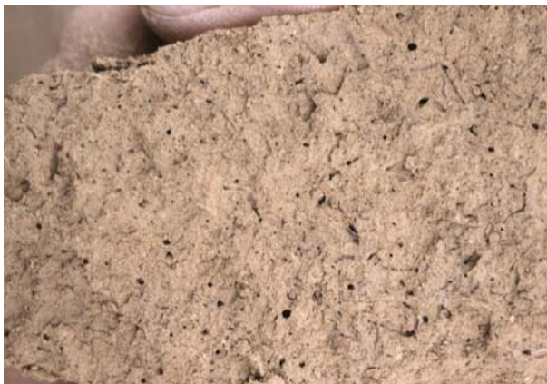
Abb. 29: Kohärentgefüge, günstig (Gefügenote 2), Löss in ursprünglicher Lagerung, locker, zahlreiche Grobporen