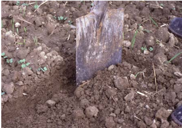
Abb. 16: Freilegung der Bestellschicht: Sie gibt Auskunft über den Bodenschluss und eine eventuelle Oberflächenverschlammung