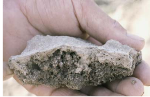
Abb. 25: Das Bild zeigt die verschlammte Schicht in Nahaufnahme. Derartige Schichten werden bei Austrocknung stein- hart (Krusten) und sind für Feinsämereien (Zuckerrüben) nahezu undurchdringlich