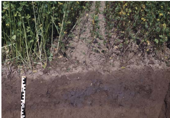
Abb. 46: Graublau, übelriechende Verfärbungen (Reduktionszonen) sind die Ursache für das Misswachstum der Rapszwischenfrucht. Sie entstanden durch Bodenverdichtung in der Schlepperspur bei der Gülleausbringung und nachfolgendes Unterpflügen der Gülle

Färbung und Farbmuster eines Bodens stehen in enger Beziehung zur Wirksamkeit des Porensystems. Gleichmäßig braune Farben zeigen eine für das Pflanzenwachstum ausreichende Durchlüftung an. Blaugraue Farben, Rostflecken und Konkretionen sind Anzeichen für Nässe. Übler Geruch kommt von Fäulnisprozessen und ist ein Indiz für starke Verdichtungen.