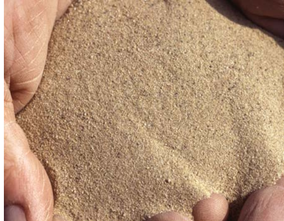
Abb. 28: Einzelkorngefüge. Die Mineralkörner liegen lose nebeneinander, geringes Wasserhaltevermögen (Gefügenote 3)

Die Gefügeform eines Bodens hängt zum Teil von seinem Ausgangsmaterial ab, zum Teil sind sie jedoch bewirtschaftungsbedingt. Das für die Krume anzustrebende Gefüge ist das Krümelgefüge, der „gare Boden“. Humus- und Kalkversorgung, eine gesunde Fruchtfolge und eine schonende Bearbeitung fördern seine Entstehung. Zunehmende Verdichtungen führen zu einer Abnahme der Grobporen und einer Zunahme der ungegliederten oder groben Gefügekörper.