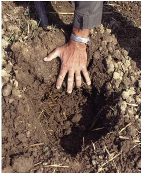
Abb. 11: Ausheben des Bodenblocks: Die eine Hand betätigt den Spaten als Hebel, die andere hält den Bodenblock auf dem Spatenblatt