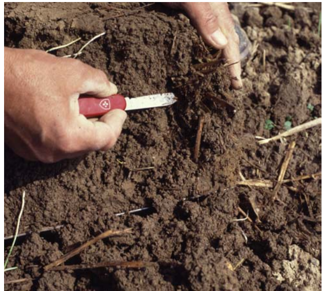
Abb. 12: Vorsichtiges Zerlegen des Bodenblocks mit den Händen oder einem Taschenmesser