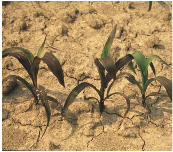
Abb. 6: Ernährungsstörung (Phosphatmangel?) bei Mais als Folge von Oberflächenverschlammung und damit einhergehender Behinderung des Gasaustausches