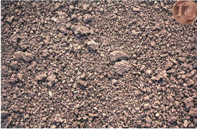
Abb. 37: Feinpolyedergefüge (Gefügezone 2) an der Oberfläche eines Tonbodens (Froststruktur)

Polyedergefüge sind typisch für tonige Böden. Man erkennt sie an ihren scharfen Kanten und glatten Oberflächen. Wasserbewegung, Durchlüftung und Durchwurzelung spielen sich auf den Oberflächen der Gefügekörper ab. Deshalb sind die Polyedergefüge um so besser zu beurteilen, je kleiner die Gefügekörper sind. Prismen- und Plattengefüge sind Grobpolyedergefüge mit vorherrschend vertikaler bzw. horizontaler Klüftung.