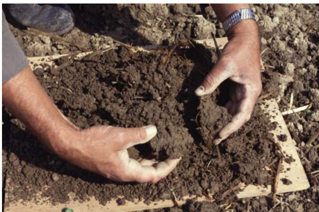
Abb. 14: Beim behutsamen Zerteilen werden Gefügeform, Farbe und Wurzelbild registriert