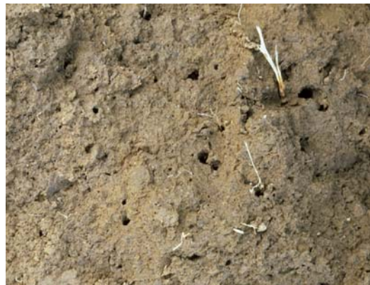
Abb. 53: Zahlreiche Regenwurmröhren an der Grenze der Bearbeitung (Pflugsohle); Sicheres Kennzeichen, dass der Unterboden nicht gelockert werden darf