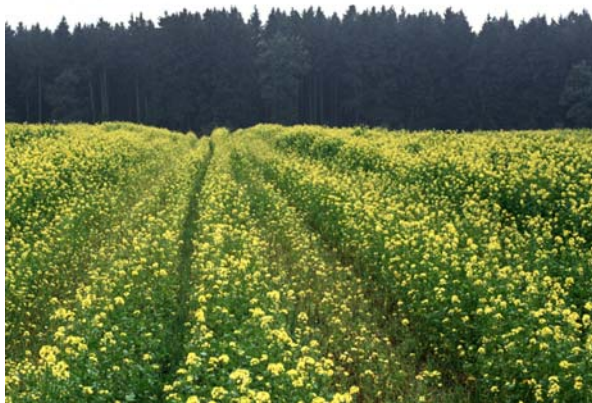
Abb. 3: Ungleichmäßiger Zwischenfruchtbestand aufgrund von Bodenverdichtung in den Fahrspuren der Gülleausbringung