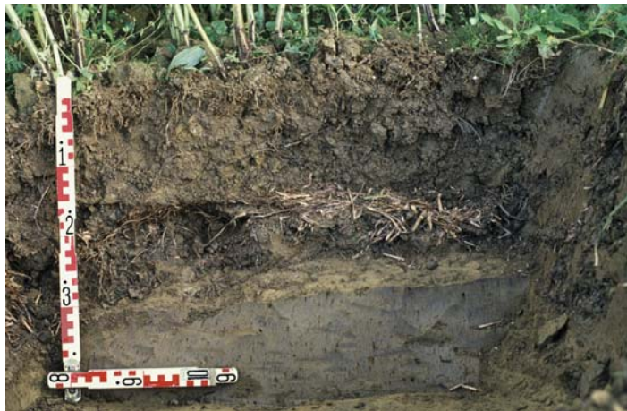
Abb. 50: „Strohmatratzen“ werden von den Wurzeln gemieden und behindern die Wasserbewegung

Klüfte und Röhren in der Pflugschicht geben Hinweise, ob eine Unterbodenlockerung Erfolg verspricht.