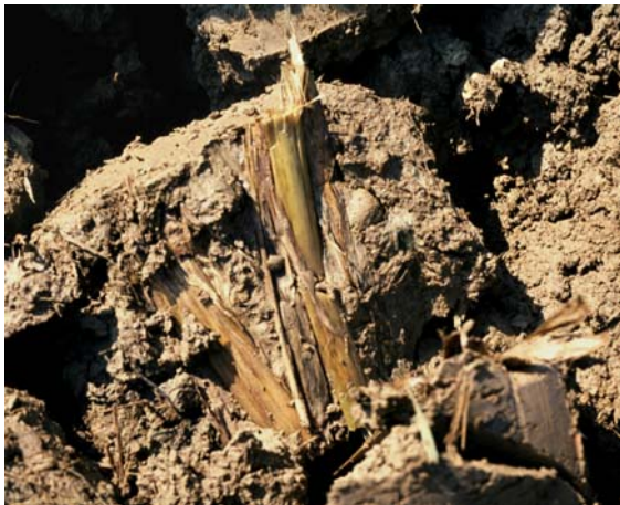
Abb. 52: Nass eingepflügetes, unverrottetes Maisstroh im Sommer des folgenden Jahres: Alarmzeichen für schlechte Bodenstruktur (schlechte Durchlüftung)