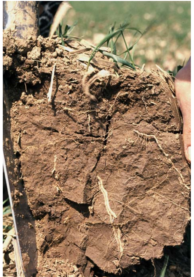
Abb. 40: Grobprismatisches Gefüge (Gefügenote 4) aus der stark verdichteten Unterkrume einer langjährig nicht gepflügten Parabraunerde aus Löß. Die Wurzeln sind durch den Quellungsdruck platt gepresst.