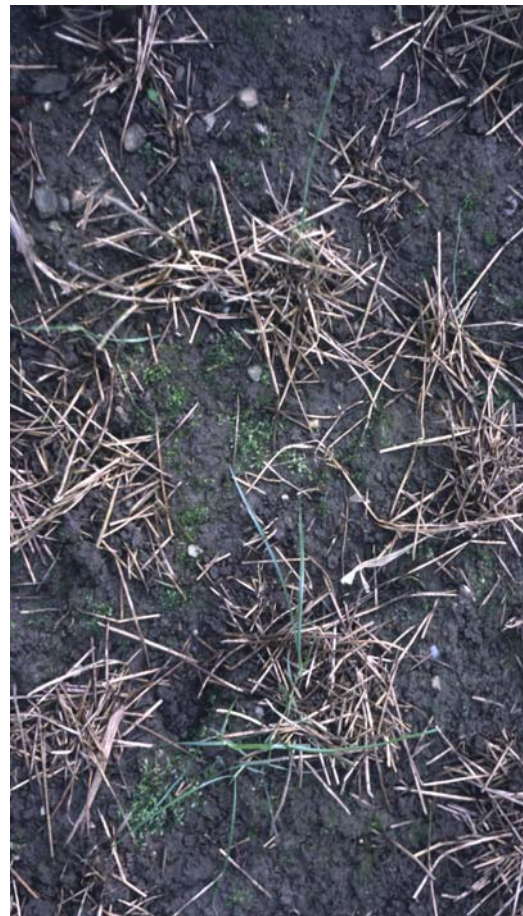
Abb. 27: Regenwürmer versuchen, das an der Oberfläche belassene Strohhäcksel in ihre Wohnhöhle zu ziehen. Dadurch ent- stehen die eine lebhaft Regenwurmakti- vität anzeigenden Strohhäufchen. Unter jedem Strohhäufchen befindet sich eine Wohnröhre.