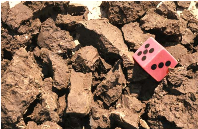
Abb. 38: Mittel- bis grobpolyedrisches Gefüge (Gefügenote 3-4): Bei Lehm Böden weisen polyedrische Gefügeformen stets auf Verdichtungen hin

Polyedergefüge sind typisch für tonige Böden. Man erkennt sie an ihren scharfen Kanten und glatten Oberflächen. Wasserbewegung, Durchlüftung und Durchwurzelung spielen sich auf den Oberflächen der Gefügekörper ab. Deshalb sind die Polyedergefüge um so besser zu beurteilen, je kleiner die Gefügekörper sind. Prismen- und Plattengefüge sind Grobpolyedergefüge mit vorherrschend vertikaler bzw. horizontaler Klüftung.