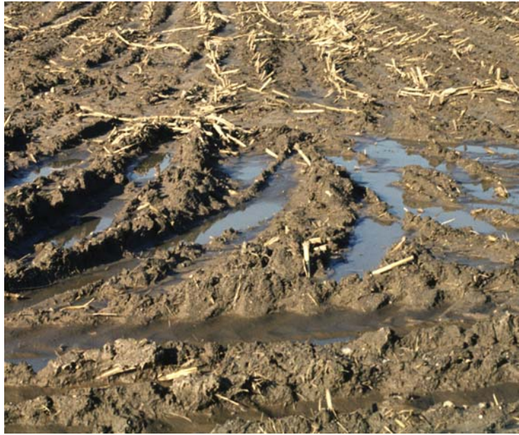
Abb. 2: Starke Bodenverdichtung und gehemmte Wasserinfiltration in den Fahrspuren nach Silomaisernnte bei feuchtem Boden