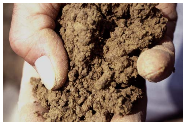
Abb. 15: Durch Zerdrücken mit der Hand werden Festigkeit und Zerfall der größeren Aggregate geprüft