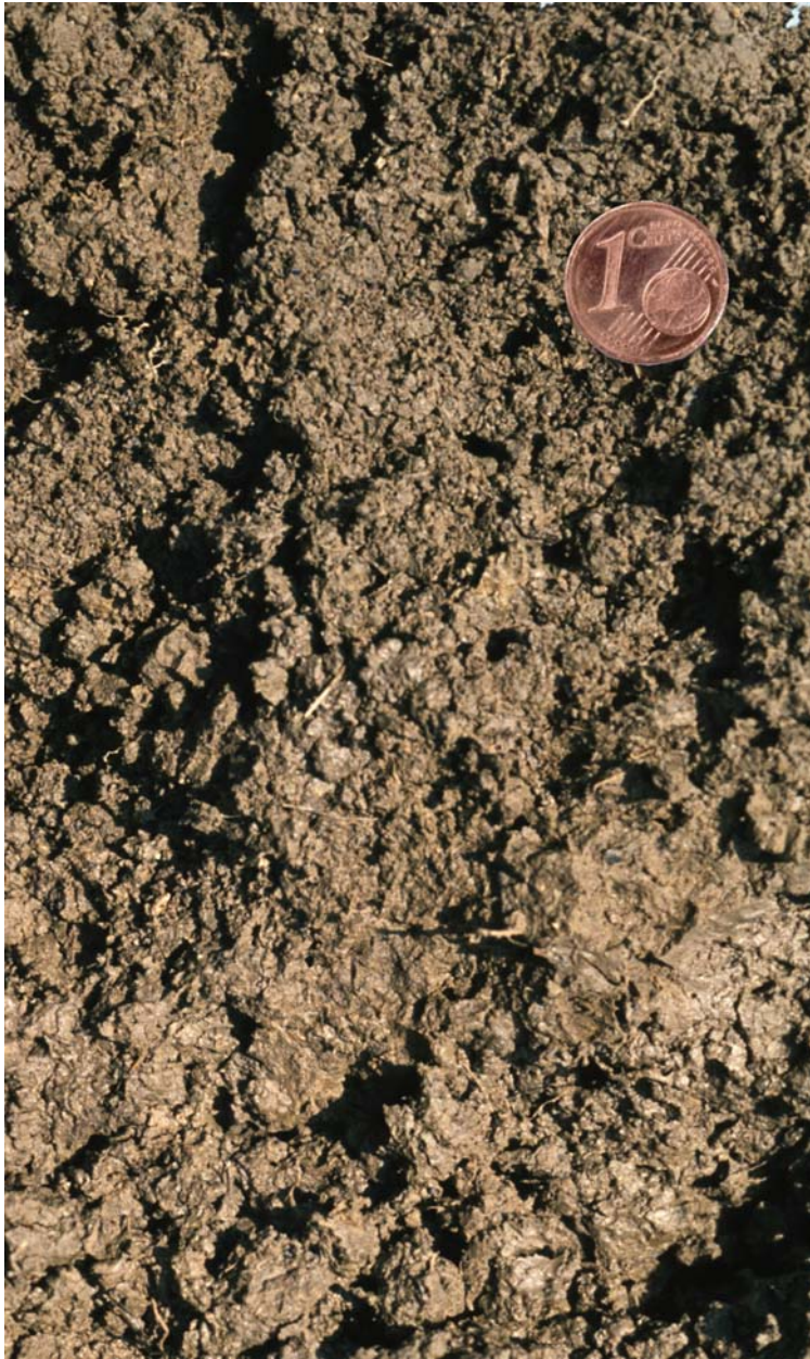
Abb. 1: Bodengefüge

Unter der Bodenstruktur oder dem Bodengefüge versteht man die räumliche Anordnung der festen Bodenbestandteile.