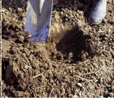
Abb. 9: Der Auswurf des Spatenstichs gibt einen ersten Hinweis auf die Gefügeform