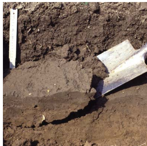
Abb. 19: Ausstechen eines Bodenblocks im Bereich der Pflugsohle: Im Bild ist eine verdichtete, verlassene Krumenschicht erkennbar