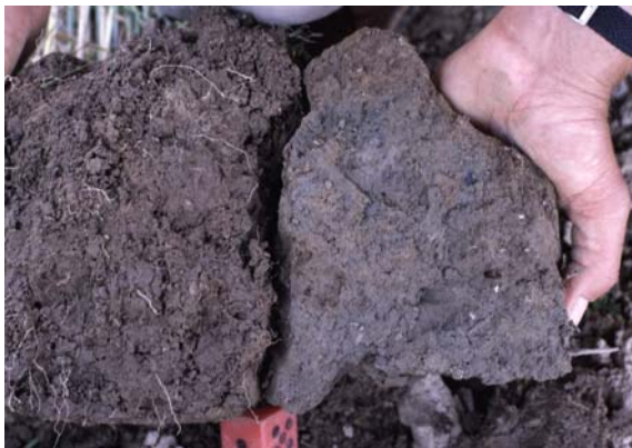
Abb. 47: Links: Bodenprobe außerhalb der Spur. Rechts: Bodenprobe in der Spur (grau-blau verfärbt)