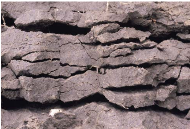
Abb. 39: Plattiges Gefüge (Gefügenote 4): Nicht bearbeitete Unterkrume einer Lößparabraunerde