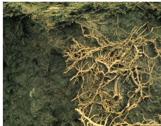
Abb. 43: Wurzelfilz auf einer Kluftfläche eines dichten, sonst kaum durchwurzelbaren Kohärentgefüges (sehr ungünstig)