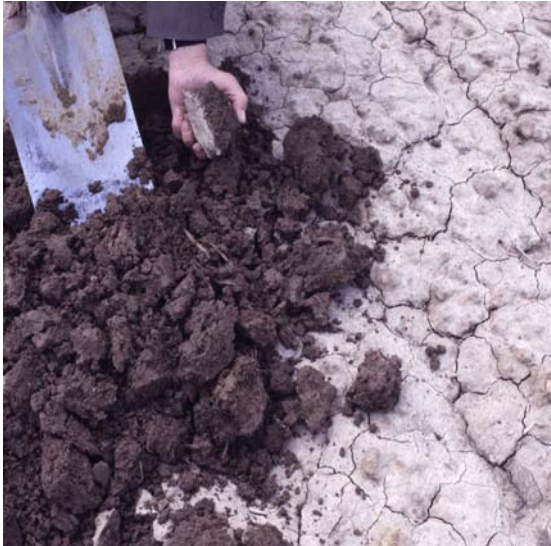
Abb. 24: Stark verschlammter Lößlehmbo- den, Schluff- und Tonteilchen haben sich entmischt. Die gute Krümenstruktur ist durch eine wenige Millimeter dicke Schluffschicht versiegelt. Gasaustausch und Infiltration sind stark behindert. Der Boden ist stark erosionsgefährdet.