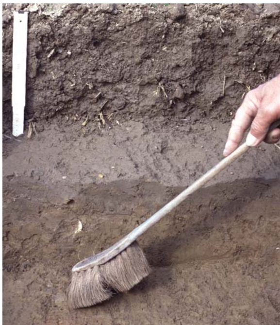
Abb. 18: Freilegen der Pflugsohle und des tieferen Unterbodens durch stufenweises Tiefergraben: Durch vorsichtiges Auskehren wird nach Röhren und Klüften gesucht