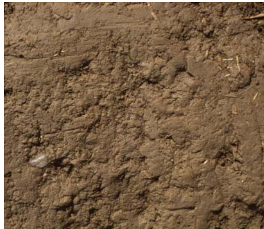
Abb. 54: Fehlen von Wurmlöchern und Klüften und dichtes Kohärentgefüge lassen eine Unterbodenlockerung geraten erscheinen