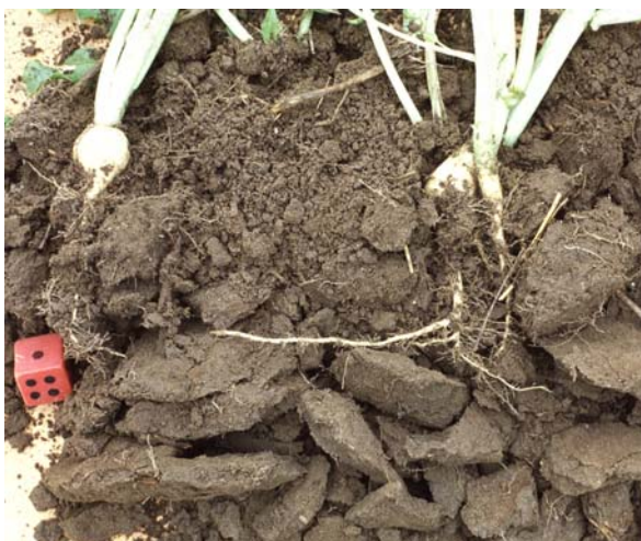
Abb. 44: Gehemmte Durchwurzelung durch plattiges Gefüge an der Untergrenze der bearbeiteten Schicht (ungünstig)