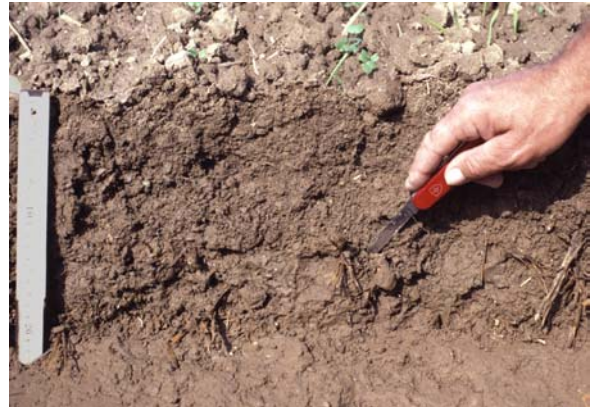
Abb. 17: Freilegung der Krume: Mit einem Taschenmesser werden der Übergang von Ober- zu Unterkrume, Verdichtungen, organische Reste u. a. sondiert