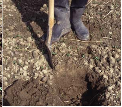
Abb. 10: Der auszuhebende Bodenblock wird durch seitliches Einstechen abgegrenzt