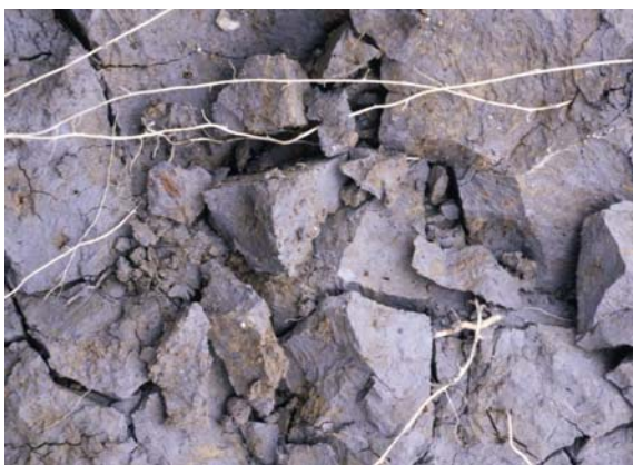
Abb. 48: Graue Grundfarbe und Rostflecken zeigen Luftmangel eines Gleybodens durch Grundwassereinfluss